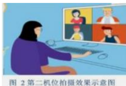
图 2 第二机位拍摄效果示意图