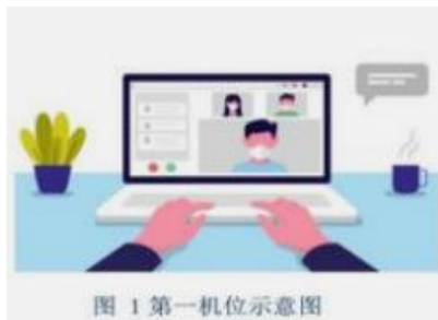
图 1 第一机位示意图